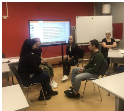
Школьная служба примирения