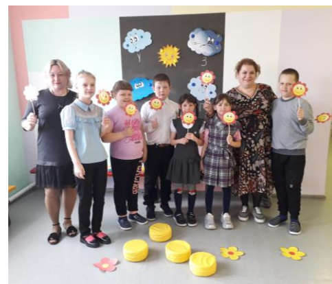
Занятия по развитию эмоций с психологом и дефектологом