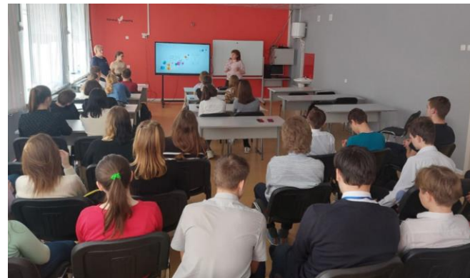
Родители-участники Программы по РЛП