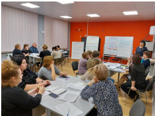
Творческие лаборатории для педагогов