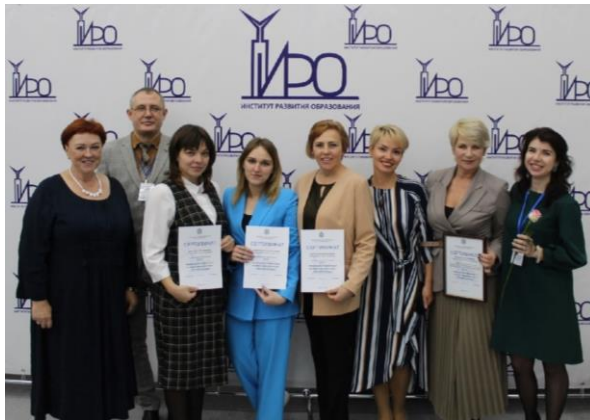
Транслирование опыта коллегам