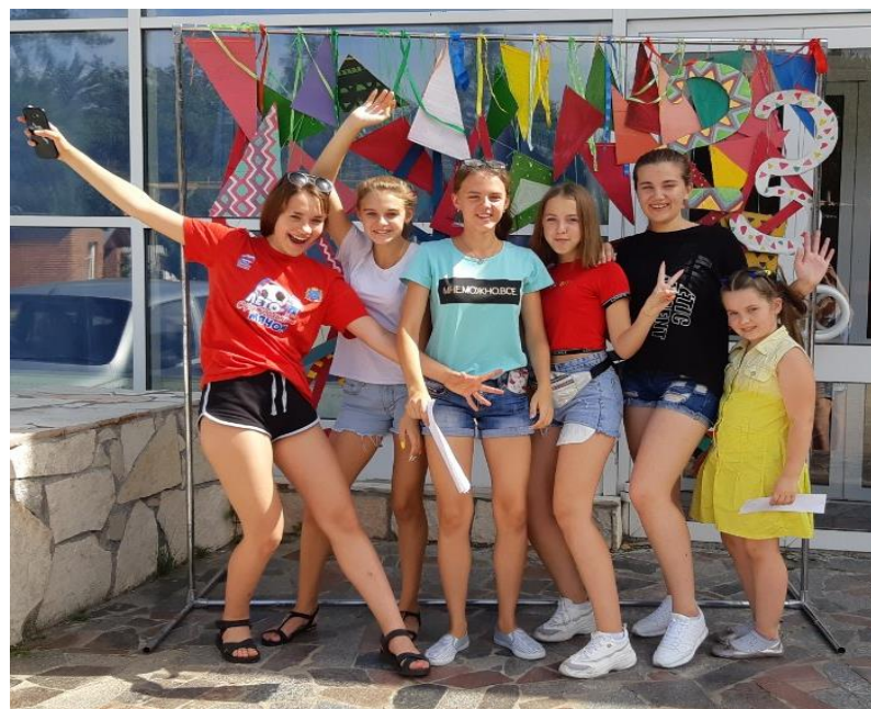
23 Фестиваль детских и молодежных организаций «Единство непохожих»