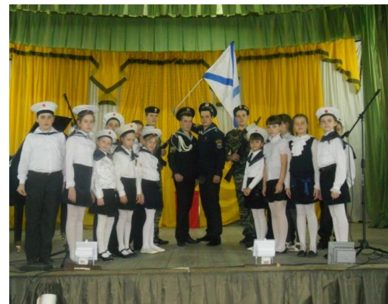
Фестиваль «Школьная весна»